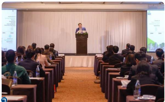
ก.ล.ต. ร่วมกับ CGIF ADB และ AIMC จัดงานสัมมนาส่งเสริมความรู้ความเข้าใจ Thailand Taxonomy

• ส่งเสริมความรู้และความเข้าใจเกี่ยวกับการเงินเพื่อการเปลี่ยนผ่าน (Transition Finance) ด้วยการดำเนินกิจกรรม workshop และเวทีแลกเปลี่ยนความคิดเห็นกับหน่วยงานระหว่างประเทศและผู้มีส่วนเกี่ยวข้อง โดยร่วมกับ Glasgow Financial Alliance for Net Zero (GFANZ) และ United Nations Environment Programme Finance Initiative (UNEP FI) จัดสัมมนา “The Fortitude Series (Thailand): What is Transition Finance?” เพื่อสร้างความเข้าใจในบทบาทของ Transition Finance ในการสนับสนุนภาคเศรษฐกิจที่ยังไม่เป็นสีเขียวแต่มีแนวทางการลดการปล่อยก๊าซเรือนกระจกอย่างชัดเจน รวมถึงร่วมกับ Global Green Growth Institute (GGGI) จัดประชุมรับฟังความคิดเห็น