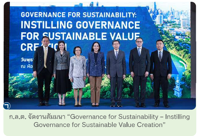
ก.ล.ต. จัดงานสัมมนา “Governance for Sustainability – Instilling Governance for Sustainable Value Creation”

ก.ล.ต. ส่งเสริมการพัฒนาตลาดทุนให้เป็นกลไกสำคัญในการสนับสนุนการระดมทุนและการลงทุนเพื่อความยั่งยืน โดยมุ่งสร้างกรอบมาตรฐานและหลักเกณฑ์ที่เอื้อต่อการระดมทุนของภาคธุรกิจ ควบคู่กับการคุ้มครองผู้ลงทุน เพื่อให้สอดคล้องกับพัฒนาการในระดับประเทศและสากล รวมถึงสนับสนุนการบรรลุเป้าหมายยุทธศาสตร์ชาติด้านความยั่งยืน ผ่านการดำเนินงานสำคัญ เช่น