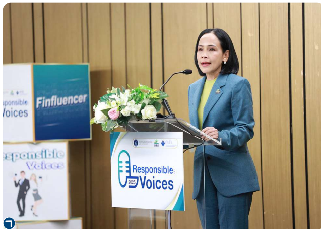
งานเปิดโครงการ Responsible Voices สำหรับ finfluencer รุ่นที่ 2

• เน้นย้ำการให้ข้อมูลแก่ผู้ลงทุนอย่างถูกต้อง : ปรับเกณฑ์การโฆษณาของผู้ประกอบธุรกิจให้สอดคล้องกับโฆษณาแบบใหม่ พร้อมทั้งออกแนวปฏิบัติที่ควรและไม่ควรดำเนินการสำหรับ finfluencer พร้อมดำเนินโครงการ Responsible Voices สำหรับ finfluencer รุ่นที่ 1-2 ร่วมกับ ธปท. และ คปท. โดยมี finfluencer เข้าร่วมรวม 74 เพจ/ช่อง และส่งต่อข้อมูลสู่ผู้ติดตามกว่า 28 ล้านราย นอกจากนี้ยังสร้างความตระหนักรู้ให้ประชาชนเกี่ยวกับการใช้ข้อมูลจาก finfluencer โดยมีการเข้าถึง (reach) รวมจากทุกช่องทางมากกว่า 1 ล้าน reaches