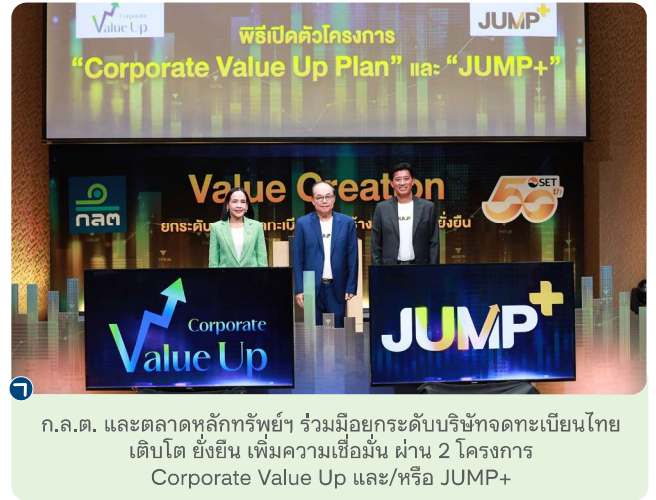
ก.ล.ต. และตลาดหลักทรัพย์ฯ ร่วมมือยกระดับบริษัทจดทะเบียนไทย เด็บโต ยั่งยืน เพิ่มความเชื่อมั่น ผ่าน 2 โครงการ Corporate Value Up และ/หรือ JUMP+

• ยกระดับคุณภาพการทำหน้าที่ของผู้ร่วมตลาด : ออกแนวปฏิบัติการควบคุมภายในที่เน้นการทำหน้าที่ของผู้ตรวจสอบภายใน และติดตามการทำหน้าที่ของที่ปรึกษาทางการเงิน รวมทั้งจัดทำระบบค่าขอลิเกทรอนิกส์ให้บริษัท/บุคคล สามารถขออนุญาต/ต่ออายุได้โดยสะดวก และเก็บเป็นฐานข้อมูลเพื่อวิเคราะห์ต่อ ยอดในการบังคับใช้กฎหมาย