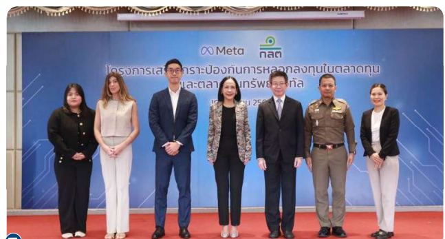
ก.ล.ต. ร่วมกับ Meta และ Facebook ประเทศไทย อบรมให้ความรู้ มุ่งเน้นการเสริมสร้างการปกป้องธุรกิจและทรัพย์สินแบรนด์