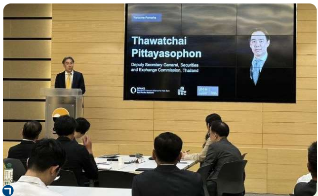
ก.ล.ต. ร่วมกับ GFANZ และ UNEP FI จัดสัมมนา “The Fortitude Series (Thailand): What is Transition Finance?”