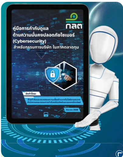
ก.ล.ต. ออกคู่มือการกำกับดูแล ด้านความมั่นคงปลอดภัยไซเบอร์ สำหรับกรรมการบริษัทในภาคตลาดทุน

• สื่อสารให้ตัวกลางให้บริการแก่ผู้ลงทุนด้วยความรับผิดชอบ : ออกคู่มือความคาดหวัง เช่น ทดสอบและทบทวนผลิตภัณฑ์/บริการที่เสนอต่อลูกค้าสม่ำเสมอ คัดค้านธรรมเนียมที่สะท้อนประโยชน์ที่ผู้ลงทุนได้รับ วิเคราะห์การลงทุนโดยคำนึงถึงการดำเนินธุรกิจอย่างยั่งยืน