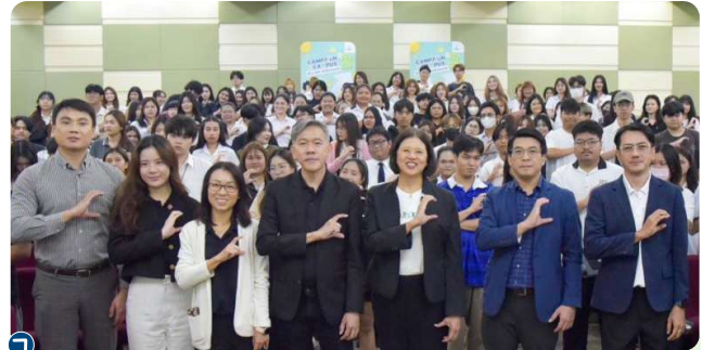
ก.ล.ต. เดินสายให้ความรู้ “Campaign on Campus Season 2 สร้าง DNA ทุกเรื่องการเงิน” ณ มหาวิทยาลัยศรีปทุม

- มียอดการเข้าถึงการประชาสัมพันธ์เตือนภัยหลอกลวงทุนกว่า 37 ล้าน reaches