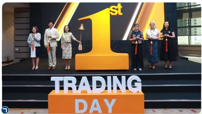
ก.ล.ต. ร่วมกับ UN Women และตลาดหลักทรัพย์ จัดกิจกรรม Ring the Bell for Gender Equality 2025 เพื่อแสดงออกถึงเจตนารมณ์ของภาคตลาดทุนไทยและองค์กรพันธมิตรในการผลักดันความเท่าเทียมทางเพศและการเพิ่มบทบาทสตรี

• ส่งเสริมบทบาทของสตรีและความเท่าเทียมทางเพศผ่านความร่วมมือกับหน่วยงานพันธมิตร อาทิ ร่วมกับองค์การเพื่อการส่งเสริมความเสมอภาคระหว่างเพศและเพิ่มพลังของผู้หญิงแห่งสหประชาชาติ (UN Women) จัดกิจกรรม Ring the Bell for Gender Equality 2025 (ต่อเนื่องเป็นปีที่ 4) และจัดอบรมคู่มือเรียนรู้วิธีสร้างการมีส่วนร่วมสำหรับองค์กรและภาคธุรกิจ (Inclusion Toolkit for Organizations and Business)