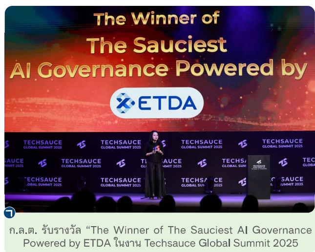
ก.ล.ต. รับรางวัล “The Winner of The Sauciest AI Governance Powered by ETDA” ในงาน Techsauce Global Summit 2025