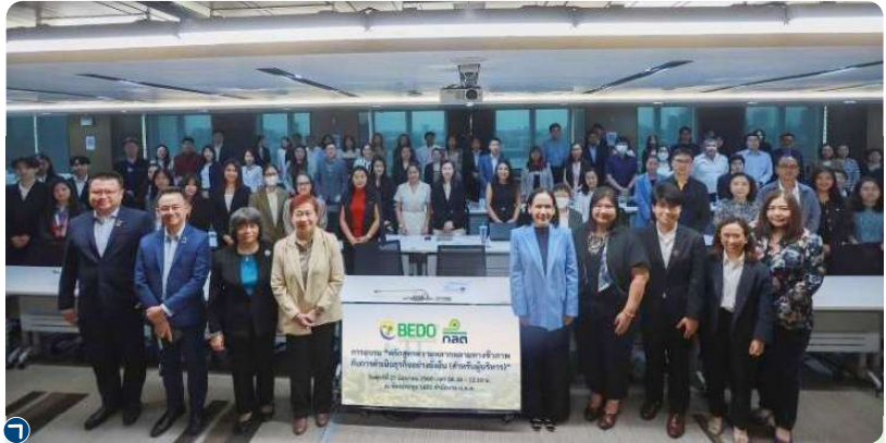
ก.ล.ต. ร่วมกับ BEDO จัดอบรม “หลักสูตรความหลากหลายทางชีวภาพกับการดำเนินธุรกิจอย่างยั่งยืน (สำหรับผู้บริหาร)” เพื่อเตรียมความพร้อมและเสริมสร้างศักยภาพของบริษัทจดทะเบียนและผู้ที่เกี่ยวข้อง ให้เกิดความตระหนักและมีความรู้ความเข้าใจถึงความสำคัญของความหลากหลายทางชีวภาพกับการดำเนินธุรกิจ

• ส่งเสริมให้ประเทศไทยบรรลุแผนปฏิบัติการด้านความหลากหลายทางชีวภาพระดับประเทศ พ.ศ. 2566-2570 (National Biodiversity Strategies and Action Plans: NBSAPs) ที่ดำเนินการโดยสำนักงานนโยบายและแผนทรัพยากรธรรมชาติและสิ่งแวดล้อม กระทรวงทรัพยากรธรรมชาติและสิ่งแวดล้อม โดยในส่วนของสอดคล้องกับพันธกิจของ ก.ล.ต. ได้กำหนดเป้าหมายให้บริษัทจดทะเบียนขนาดใหญ่ที่มีสภาพคล่องสูง 50 อันดับแรก (SET50) เปิดเผยข้อมูลการดำเนินธุรกิจที่เชื่อมโยงกับความหลากหลายทางชีวภาพ (ภาคสมัครใจ) ไม่น้อยกว่าร้อยละ 20 ภายในปี 2570 และไม่น้อยกว่าร้อยละ 30 ภายในปี 2573 ก.ล.ต. จึงได้เริ่มสร้างความตระหนักรู้และความเข้าใจเกี่ยวกับความหลากหลายทางชีวภาพด้วยการจัดอบรมและเผยแพร่ความรู้ โดยร่วมกับสำนักงานพัฒนาเศรษฐกิจจากฐานชีวภาพ (องค์การมหาชน) (BEDO) และเผยแพร่คู่มือและบทความที่เกี่ยวข้องบนเว็บไซต์ ก.ล.ต. นอกจากนี้ ก.ล.ต. ได้สนับสนุนข้อมูลประกอบการจัดทำรายงานแห่งชาติว่าด้วยความหลากหลายทางชีวภาพ ฉบับที่ 7 และรายงานผลการดำเนินงานตามแผน NBSAPs ตลอดจนให้ความเห็นแก่ BEDO เพื่อประกอบการจัดทำแนวทางการเปิดเผยข้อมูลการดำเนินธุรกิจที่เชื่อมโยงกับความหลากหลายทางชีวภาพสำหรับภาคธุรกิจไทย