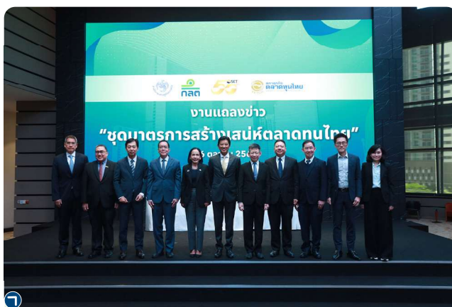
งานแถลงข่าวชุดมาตรการสร้างเส้นที่ตลาดทุนไทย

อันเนื่องมาจากการประกอบธุรกิจของบริษัทจดทะเบียนที่พัฒนาไปสู่ธุรกิจใหม่ ๆ ตามสภาพเศรษฐกิจและสภาพแวดล้อมที่เปลี่ยนแปลงไป รวมถึงให้สิทธิผู้ถือหุ้นมีส่วนร่วมตัดสินใจในรายการที่มีนัยสำคัญหรือรายการที่มีลักษณะขัดแย้งทางผลประโยชน์ และให้คณะกรรมการปฏิบัติหน้าที่โดยคำนึงถึงหลักแห่งความซื่อสัตย์สุจริตและระมัดระวังรอบคอบ