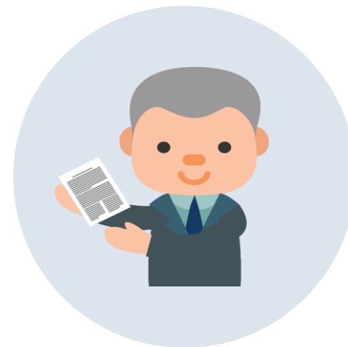
ผู้ระดมทุน