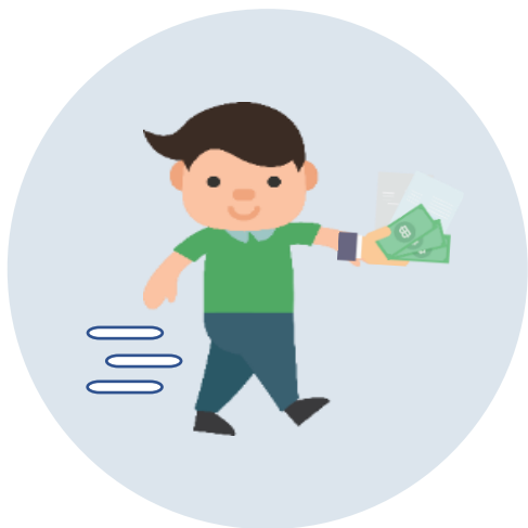
ผู้ลงทุน